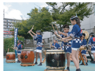
川南和太鼓クラブ