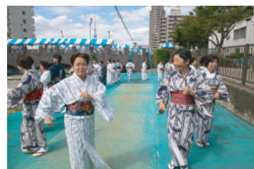
扇橋三丁目参寿会による総踊り