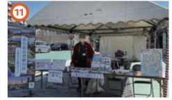
深川不動堂出張まちあるき案内所 3/20③~4/7③ 11:00~15:00 出張まちあるき案内所を開館。周辺ガイドを当日受付で承ります。 ※雨天中止