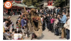
深川ハロン倶楽部「桜舞」 3/24③ 11:30~12:00/13:30~14:00 ※雨天(3/31)にイベント、パリのガムラン演奏と共に獅子舞10人が舞い踊る! 20日(日)も向けワークショップを石島橋文化センターで開催。24日は演奏と舞踊の他、子ども向けの参加型のイベントもあり。楽器体験コーナーも予定。【問い合わせ】contact@fukagawabarong.com