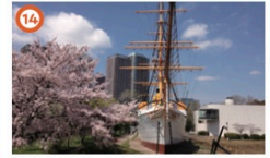
明治丸見学 3/16③、3/19③、3/21③、3/23③、3/24③、3/26③、3/28③、3/30③、3/31③ 10:00~14:30(最終入場) 明治7年に竣工した鉄船(現在の船はすべて鋼船)昭和53年には、わが国に現存する唯一の鉄船であり、鉄船時代の造船技術を今に伝える貴重な遺産として、国の重要文化財に指定されました。