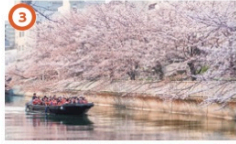
動力船(黒船橋) 3/23③~3/31③ 13:00~14:00 黒船橋を出発し、大横川を周遊&隅田川ニクルーズ【詳細は裏面をご覧ください】