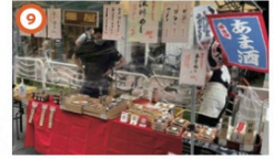
笑栄会お花見マルシェ 3/24③ 11:30~16:30 ※雨天決行 歩行者天国の牡丹町通りには、商店街のお店では食べられない、逸品や生産者直営の野菜や果物・加工品が並びます。パワーストーンのある楽しい会場でぜひお買い物をお楽しみください。皆様のご来店をよりお待ちしております。