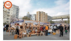
The 深川 Wood Fest 3/16③ 11:00~16:00、3/17③ 10:00~16:00 木の香り、木のまじ深川。「木と暮らす・木を楽しむ」をテーマに親子で楽しめるイベントです。木の選具やワークショップ、木製品の販売があります。 ※雨天の場合中止あり