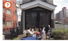
櫛下カフェ 3/20③~3/31③の土日祝 10:00~15:30 黒船橋のたもと、橋は江戸の風景の再現。椅子テーブルに寛ぎ、川面の舟漕ぎを眺めます。腰を掛けたら、観光案内マップでのご案内もしようか。