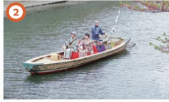
新内流し(黒船橋) 3/23③~3/31③ 13:00~14:00 三味線と歌が大横川にこだまする雅やかな時間をお楽しみいただける新内流しはお江戸深川さくらまつりのメインイベントです。