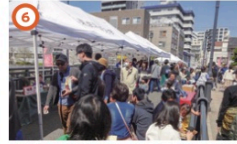
石島橋お休み処 3/20③~3/31③の土日祝 10:00~16:30 橋の上に展覧台展開。深川の名店が出店します。深川風にあじりの準焼き、カフェあり、おせんべいあり。大連雲等もありです! ※雨天中止