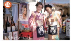
富ヶ岡さくら茶屋 3/20③、3/23③、3/30③、3/31③、4/6③、4/7③ 11:00~16:00 富岡八幡宮境内にて花見客や参拝客に楽しんでいたために、和菓子・抹茶・お漬物とともに陣取りや三味線を楽しむことが出来る期間限定の茶屋。※演目は日によって変わります。 ※雨天中止