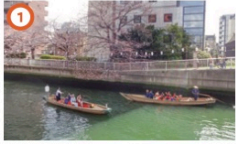
和船(黒船橋) 3/20③~4/7③の土日祝 10:00~15:00 さくらまつり期間限定で昔ながらの櫂漕ぎ船にて江戸橋から深川方面から桜見物を楽しむ事ができます。【詳細は裏面をご覧ください】